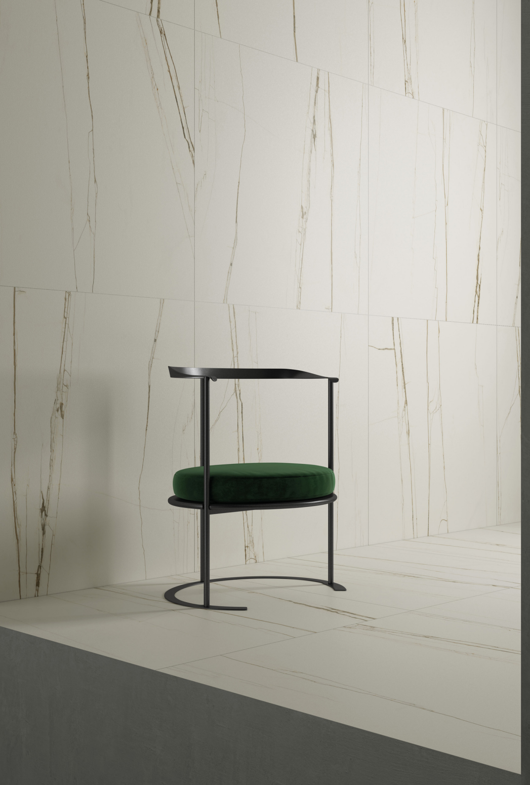
Archimarble 2 Sahara Blanc 120 × 120