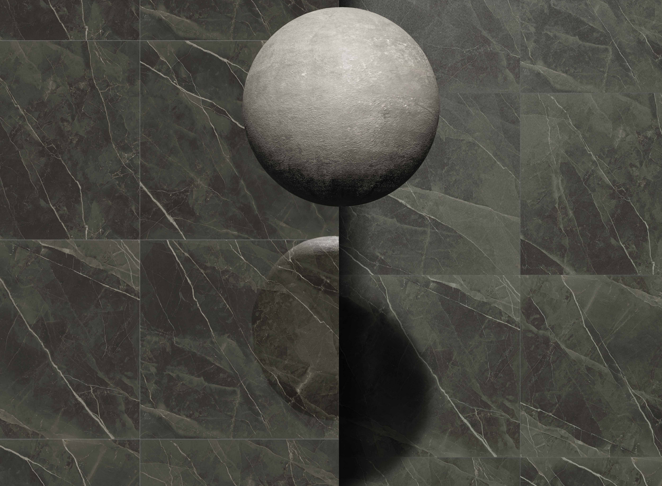
Archimarble2 Calacatta Black 120 × 120