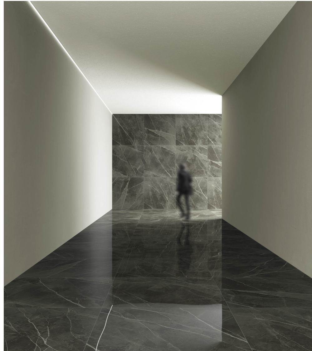
Archimarble2 Calacatta Black 120 × 120