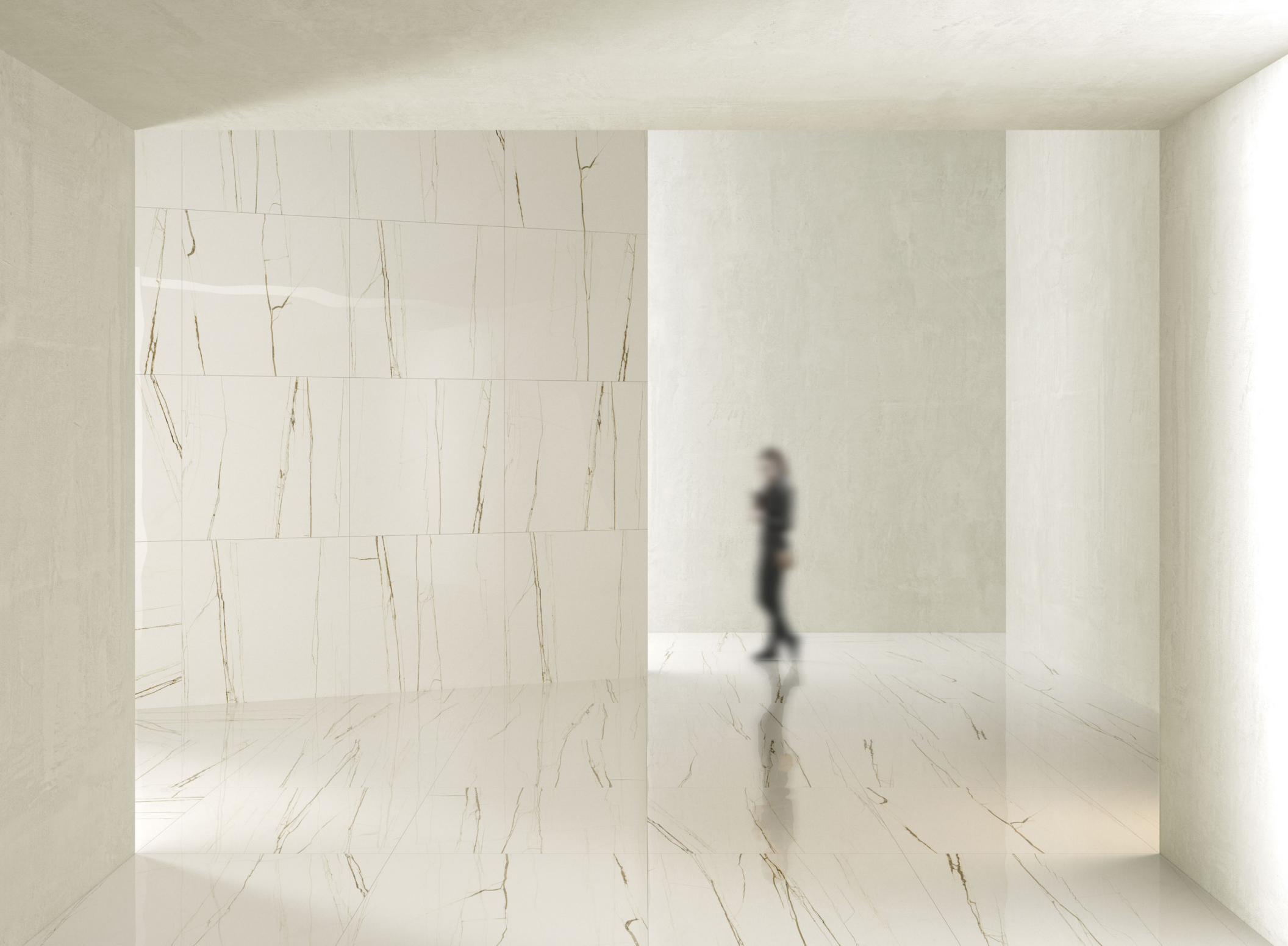
Archimarble 2 Sahara Blanc 120 × 120