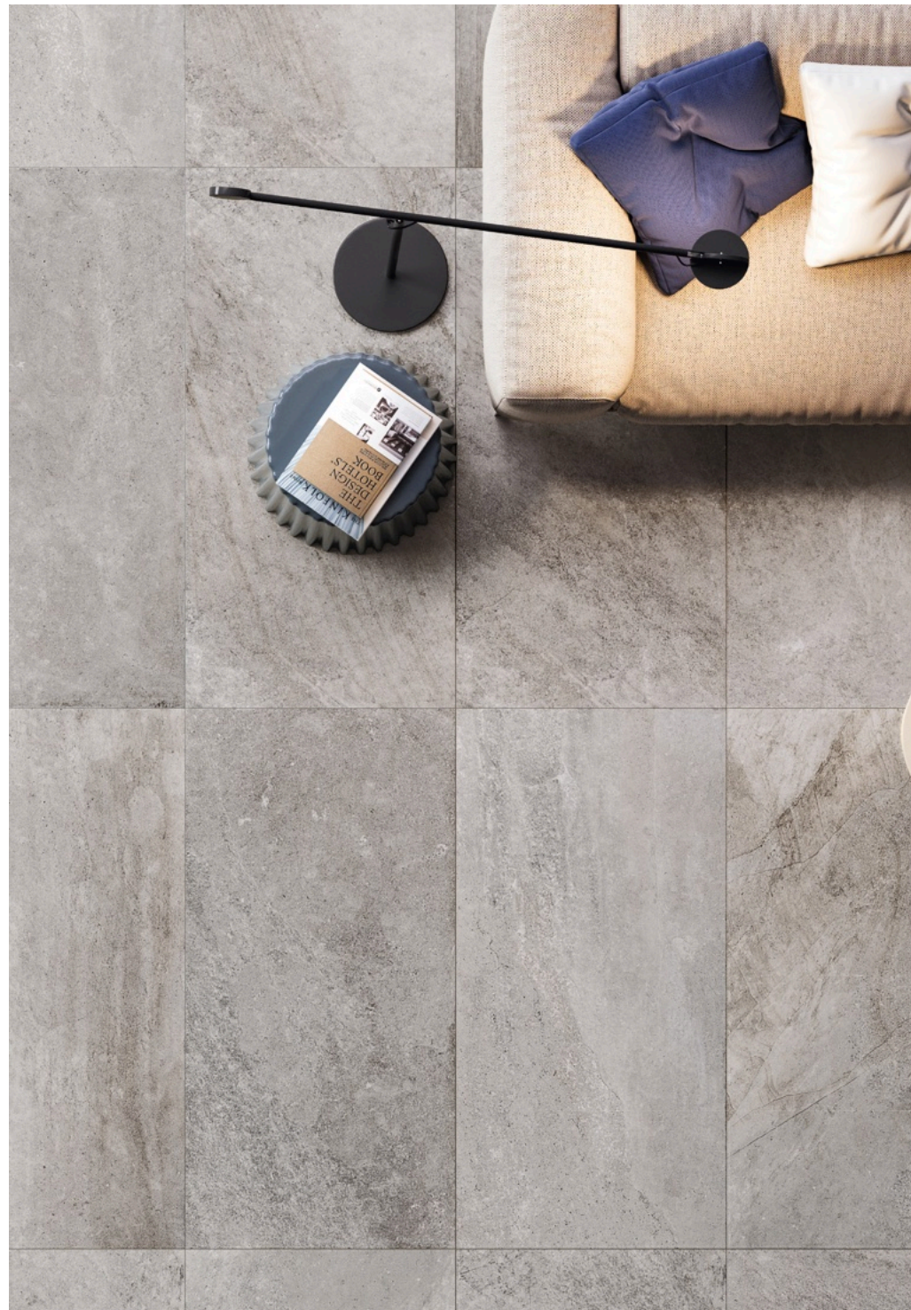
Blended Grey 60 × 120