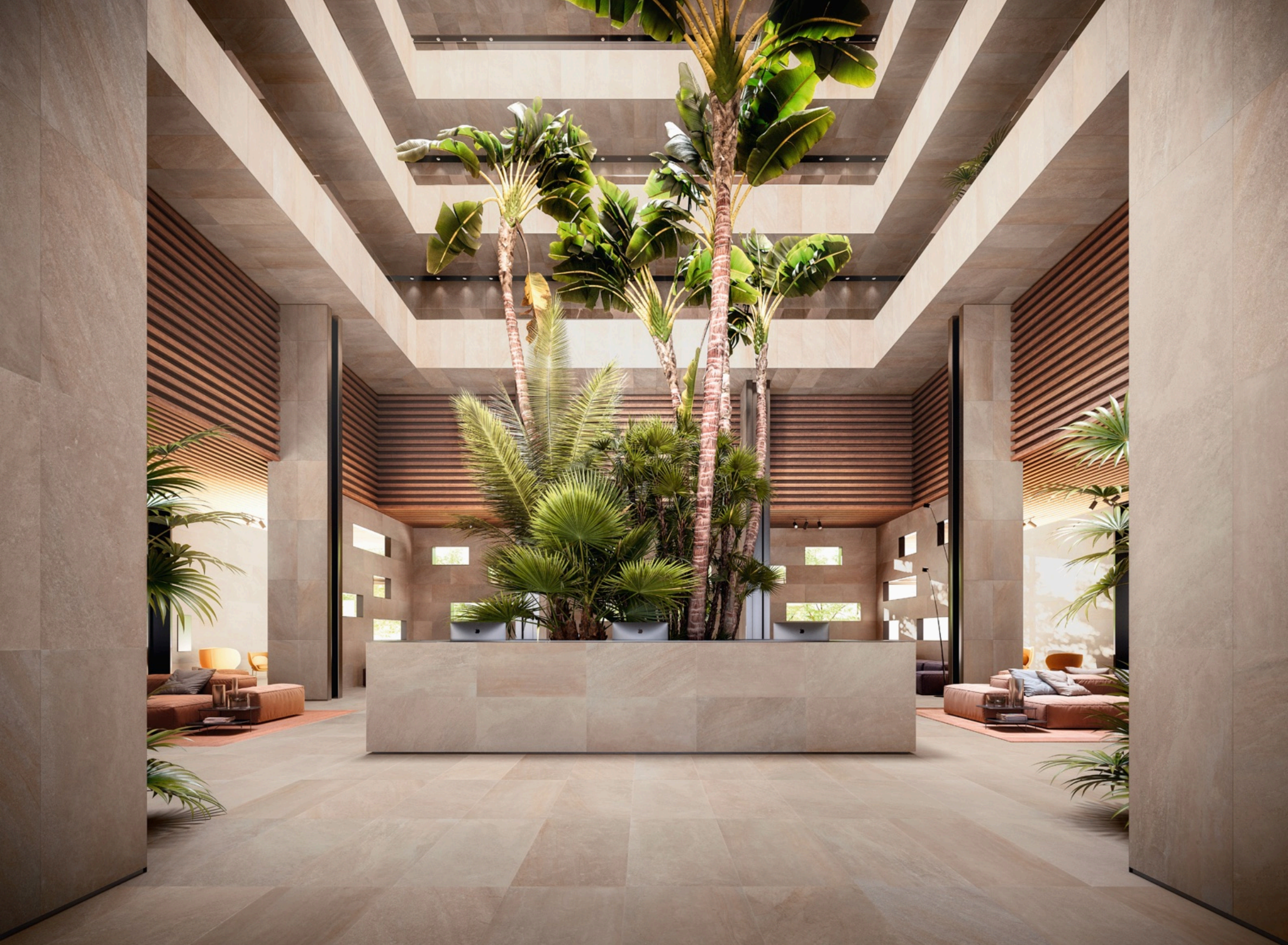
Blended Natural 60 × 120