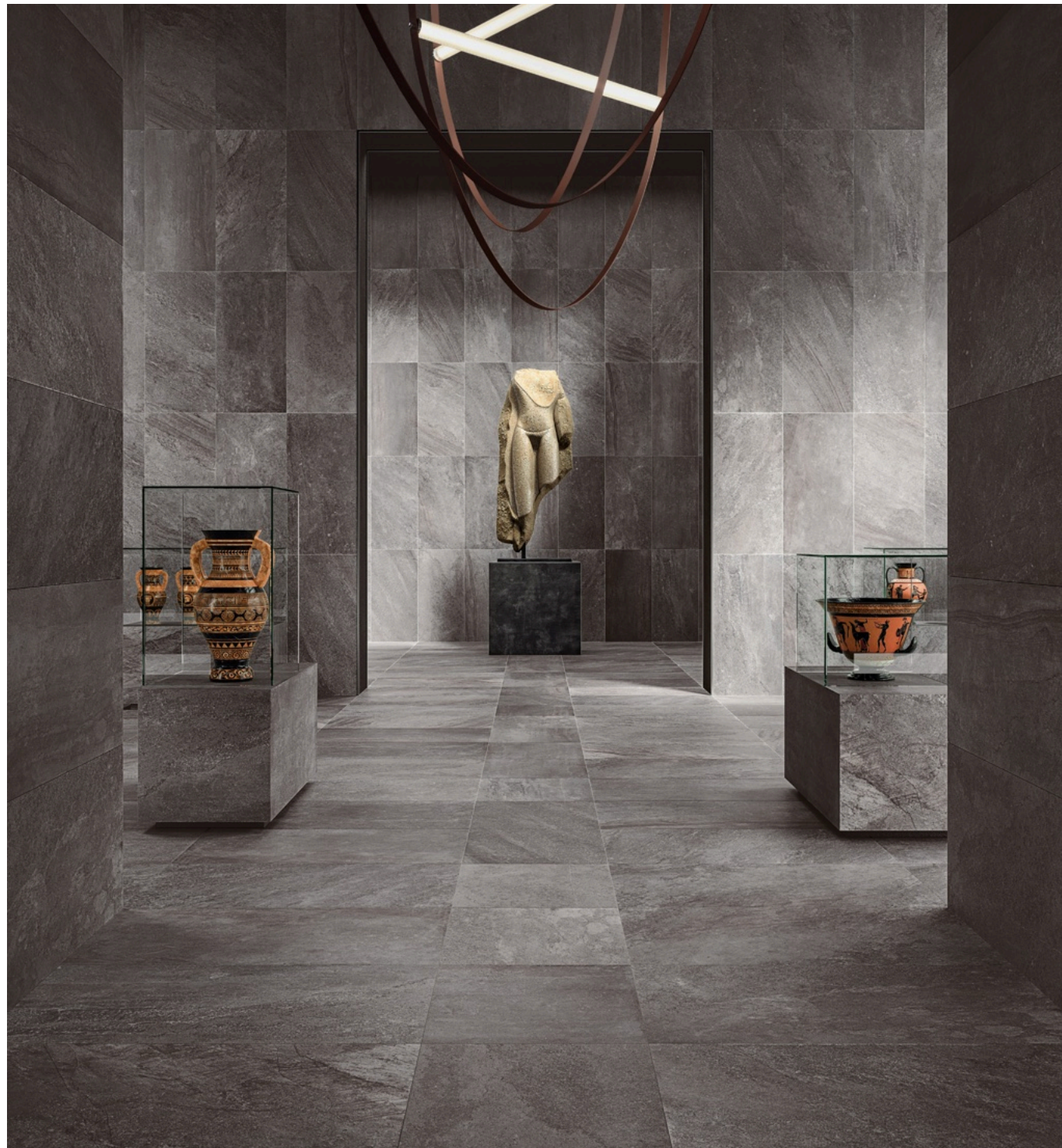
Blended Dark 60 × 120