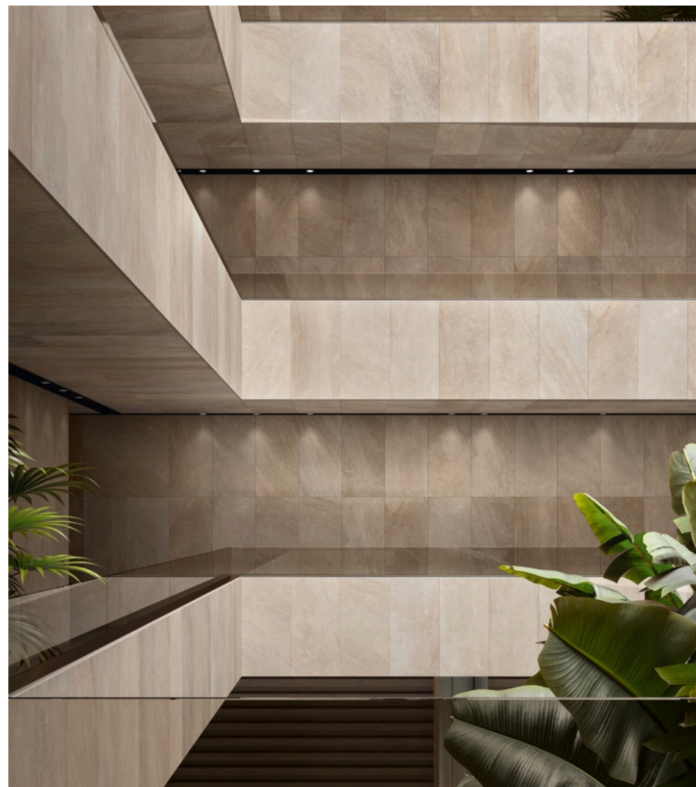
Blended Natural 60 × 120