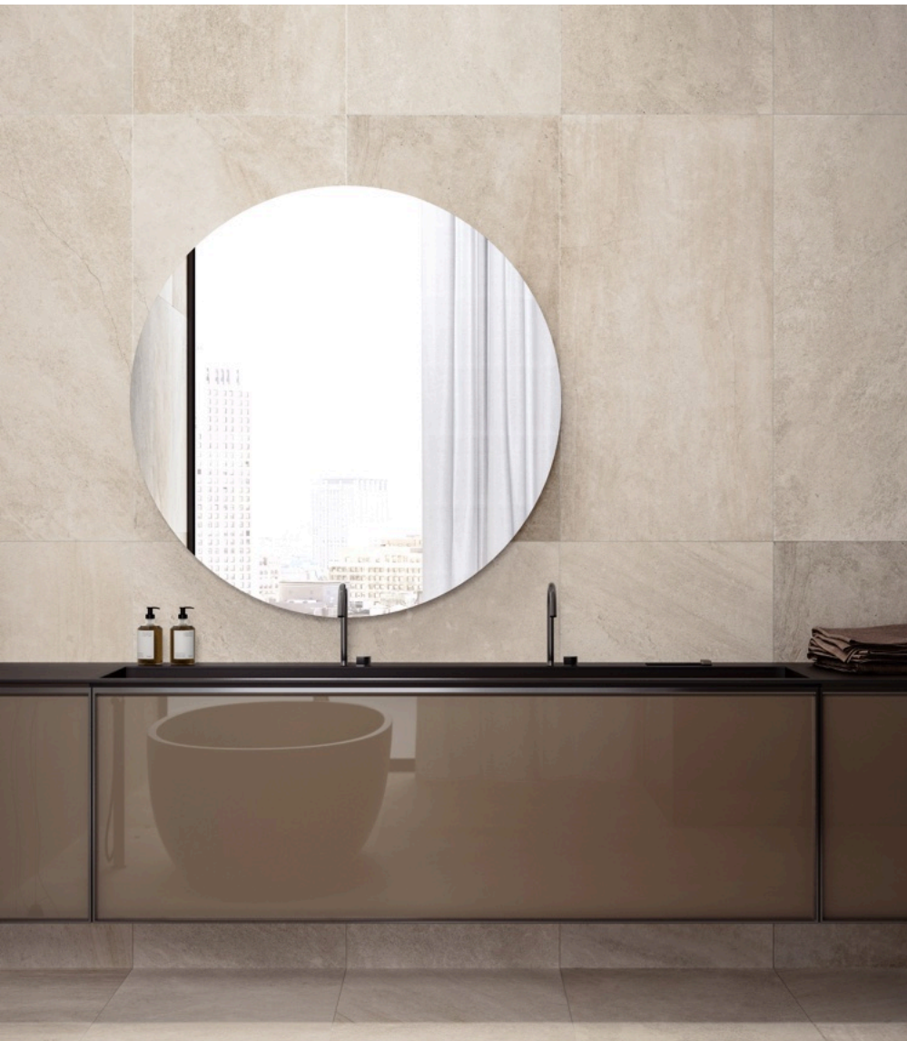
Blended Beige 60 × 120