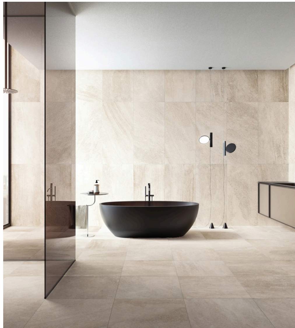
Blended Beige 60 × 120