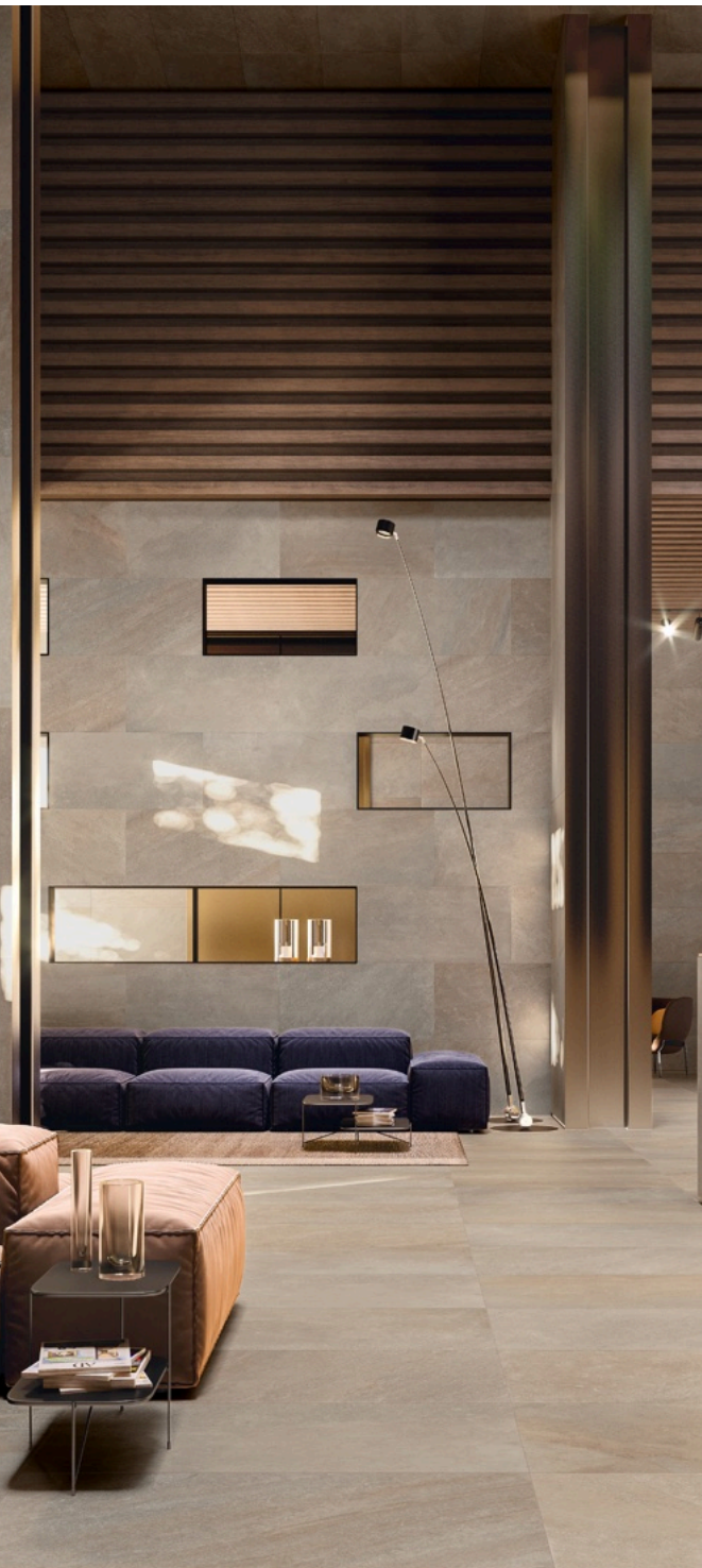
Blended Natural 60 × 120