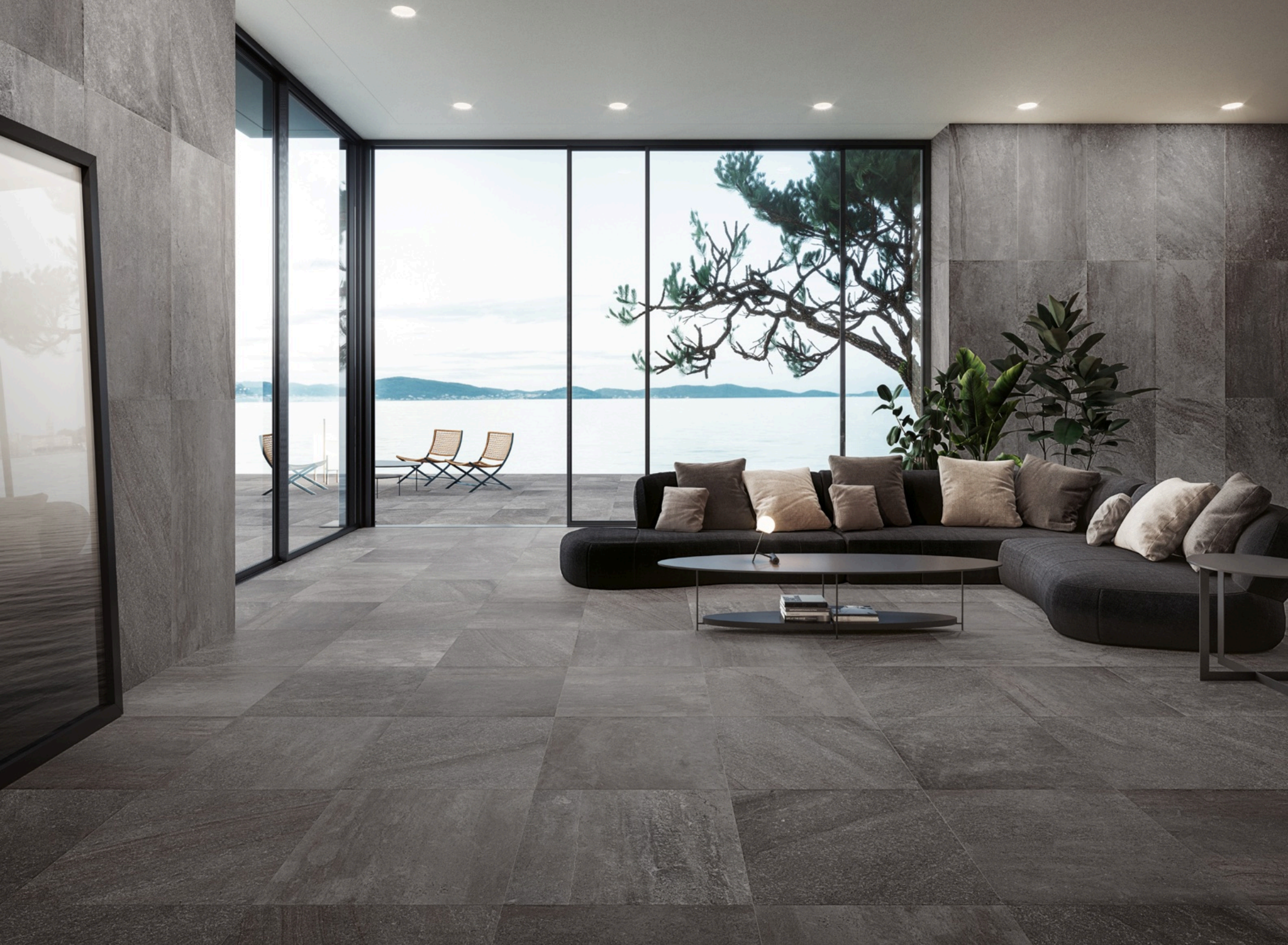
Blended Dark 60 × 120