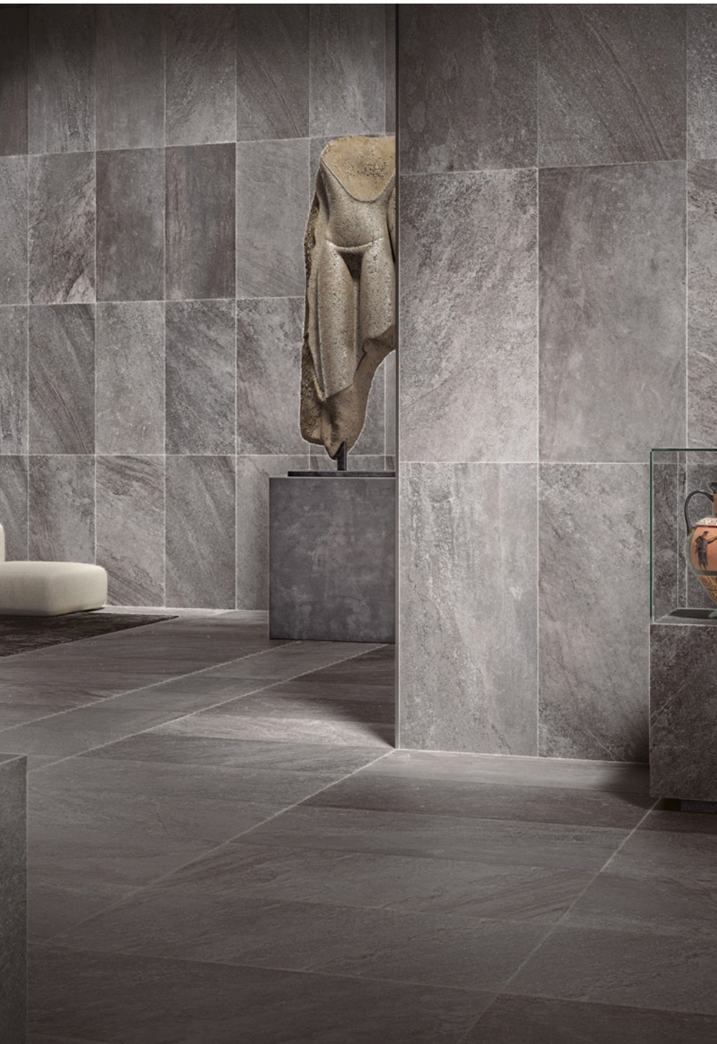
Blended Dark 60 × 120