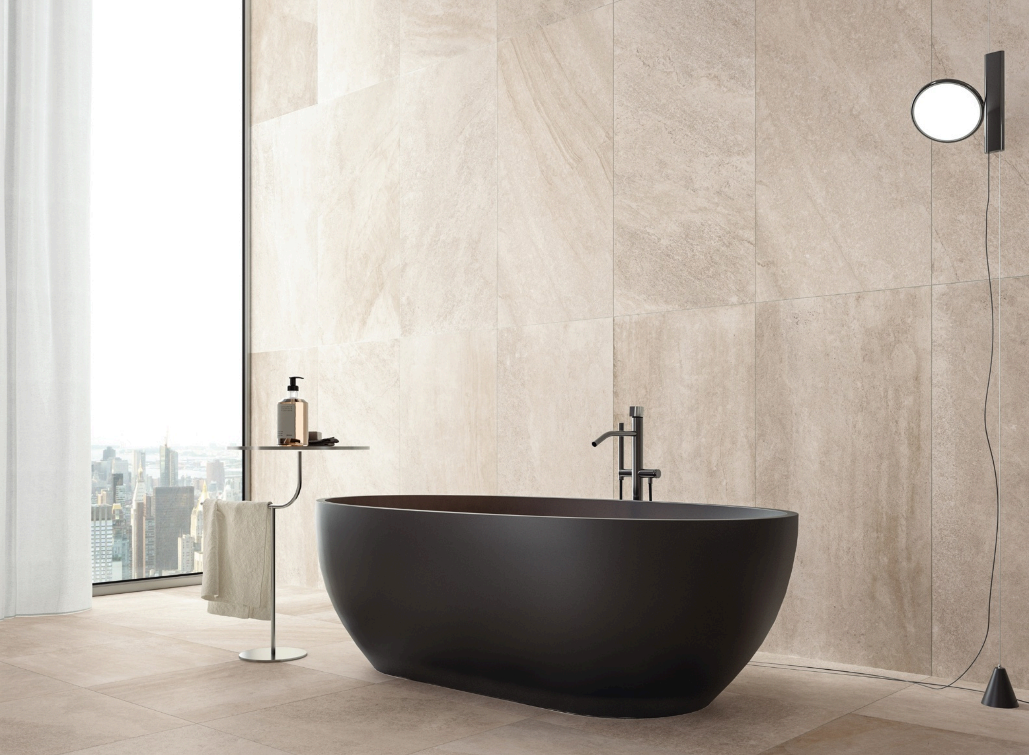
Blended Beige 60 × 120