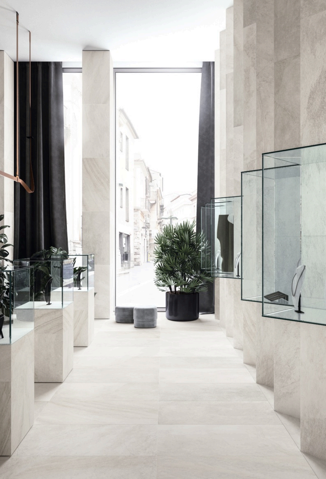
Blended White 60 × 120