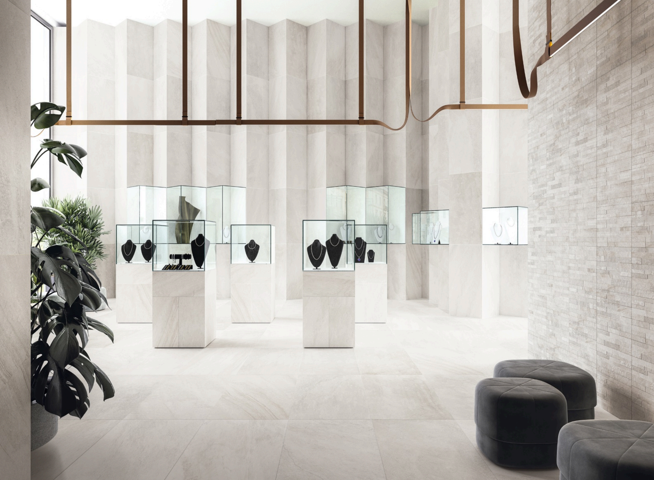
Blended White 60 × 120