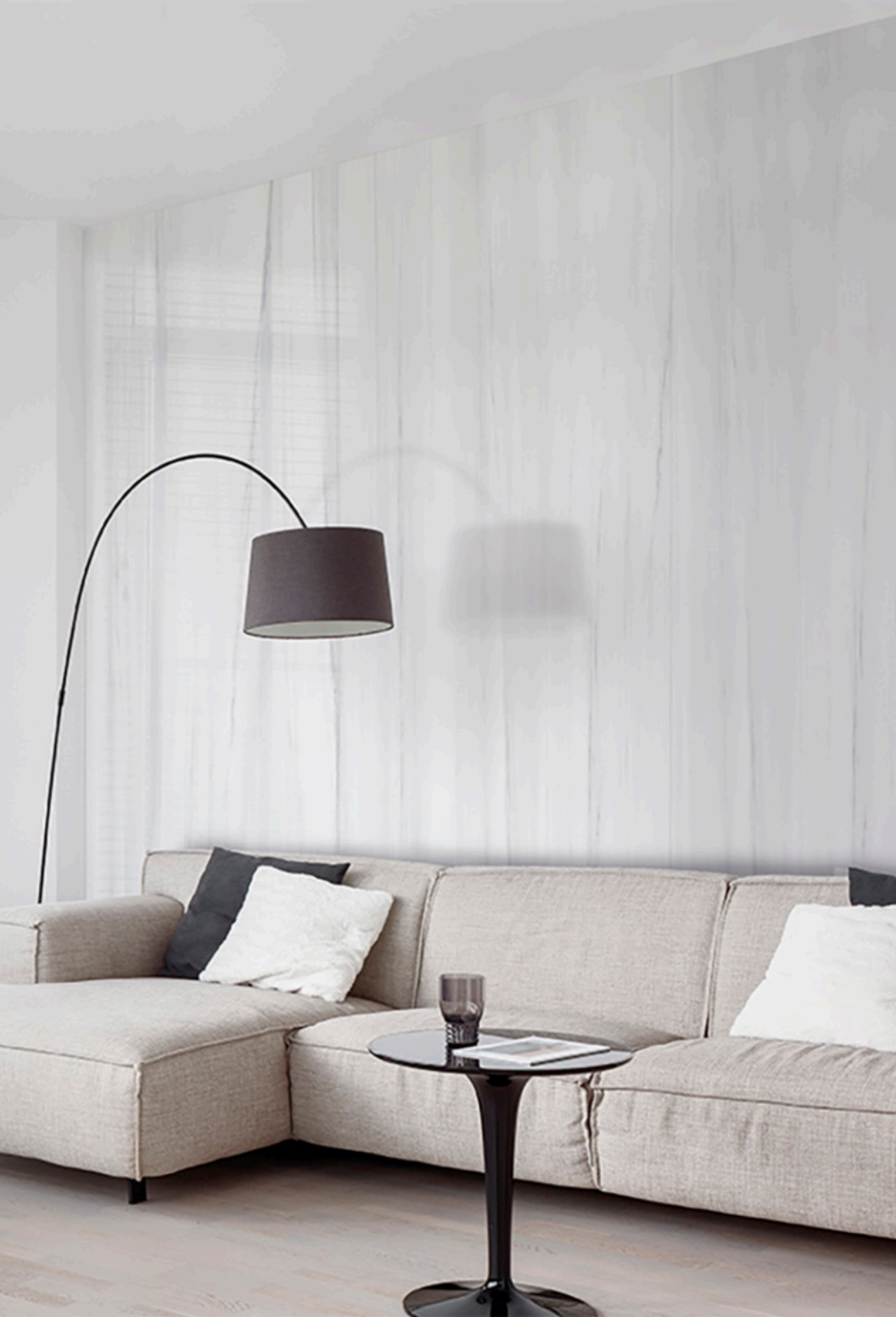
Dolomite Glossy 120 × 120