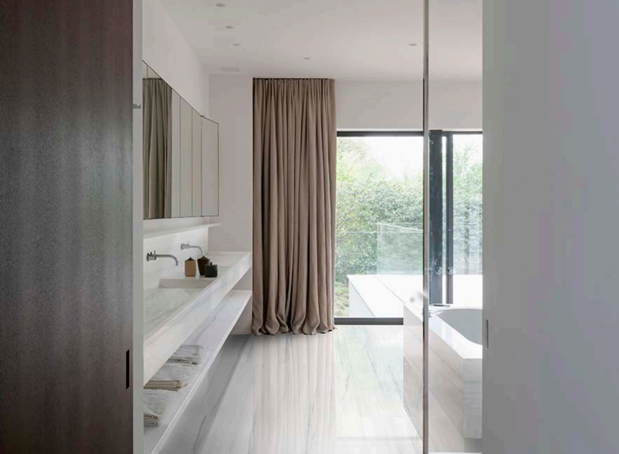
Dolomite Glossy 120 × 120