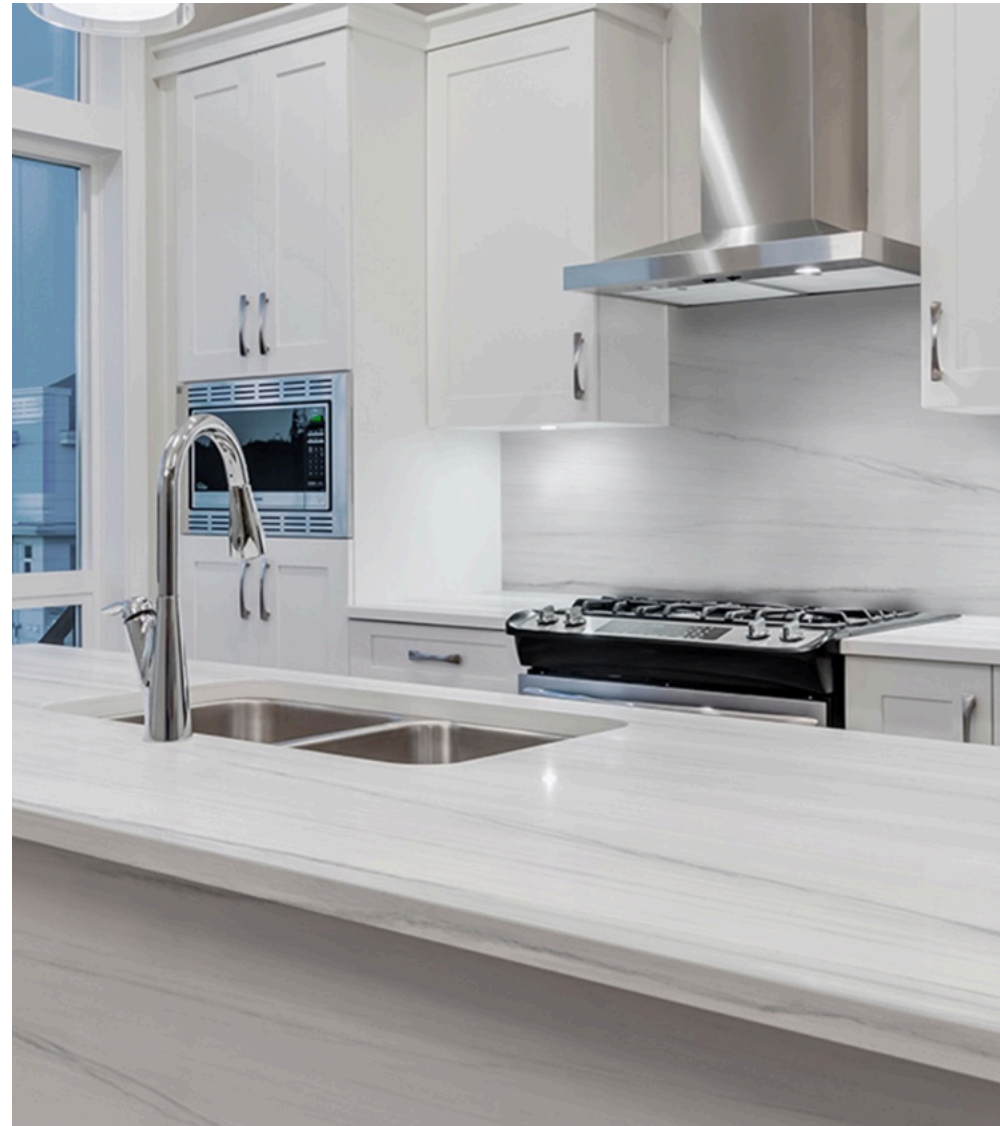
Dolomite Glossy 120 × 120