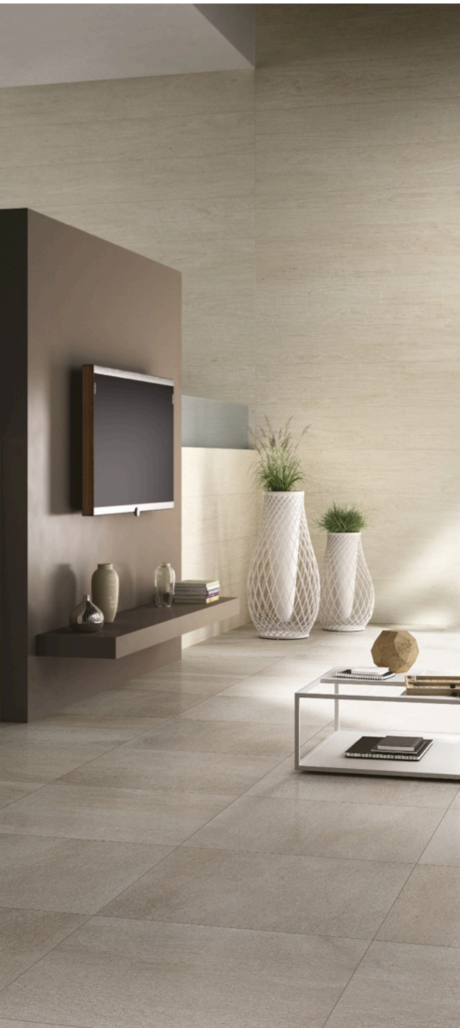
Forest Acero 33 × 300 (sobre pedido)