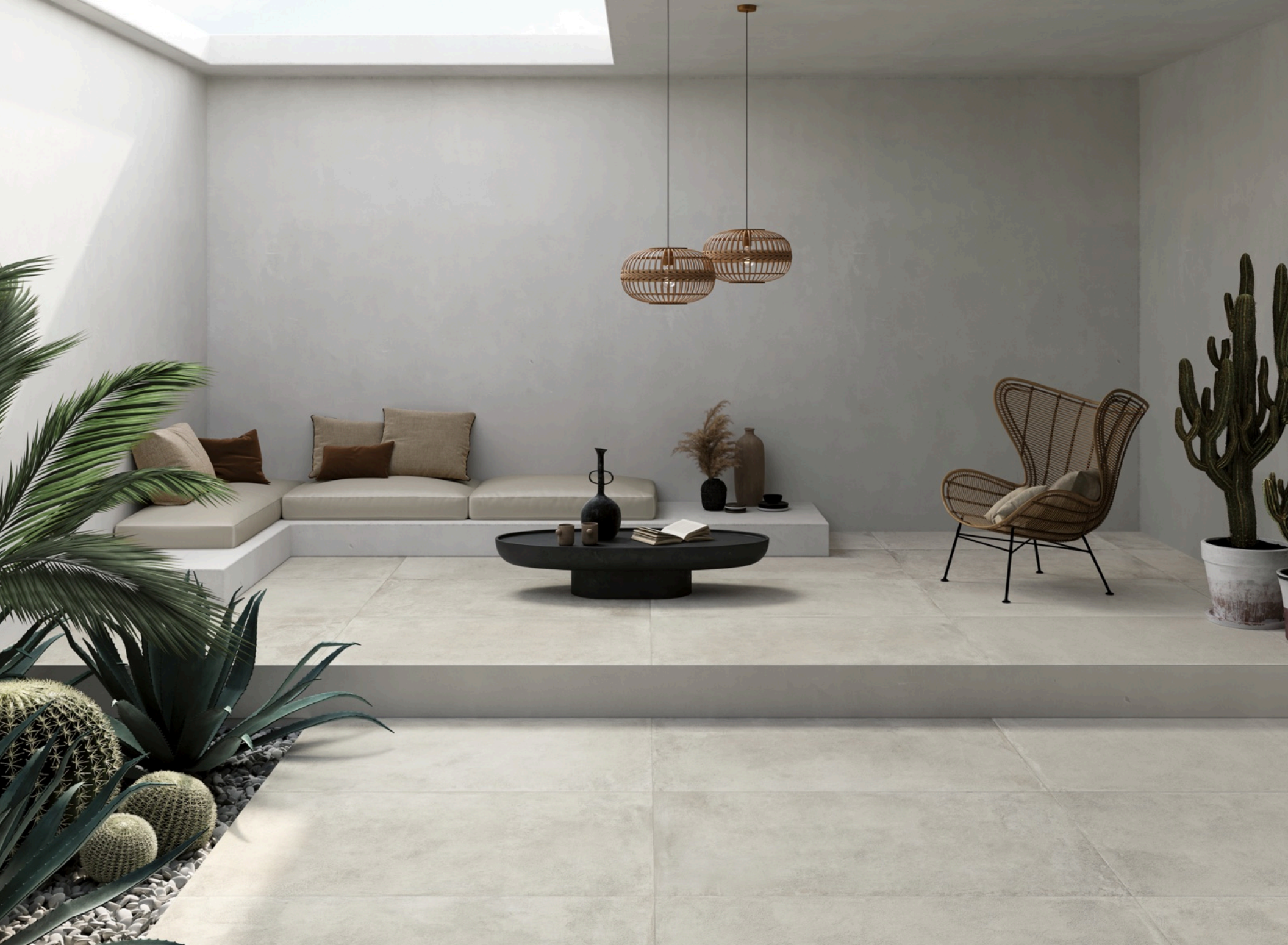
Open Air White 75 × 150