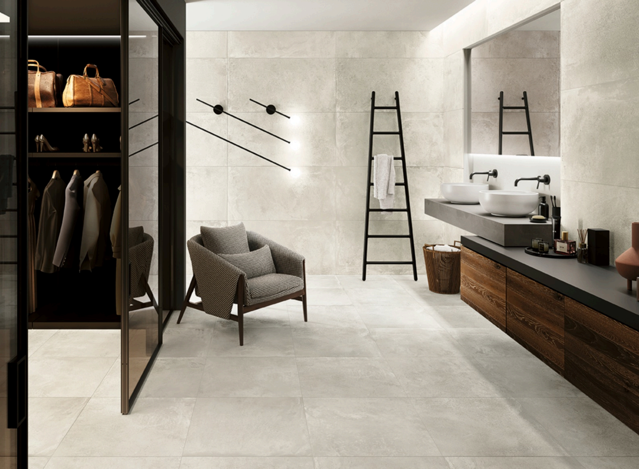
Open Air White 75 × 150