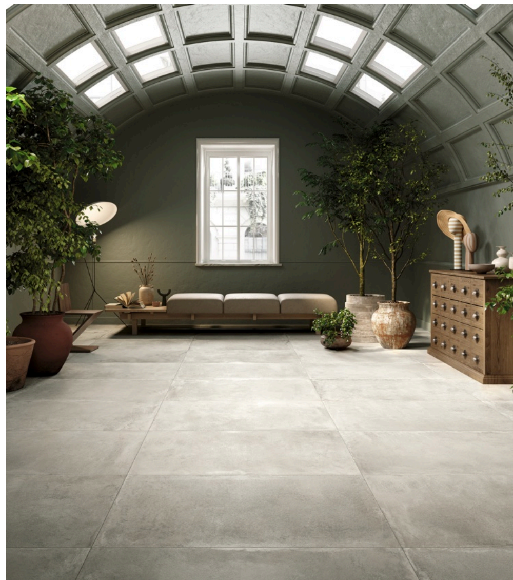
Open Air Grey 75 × 150