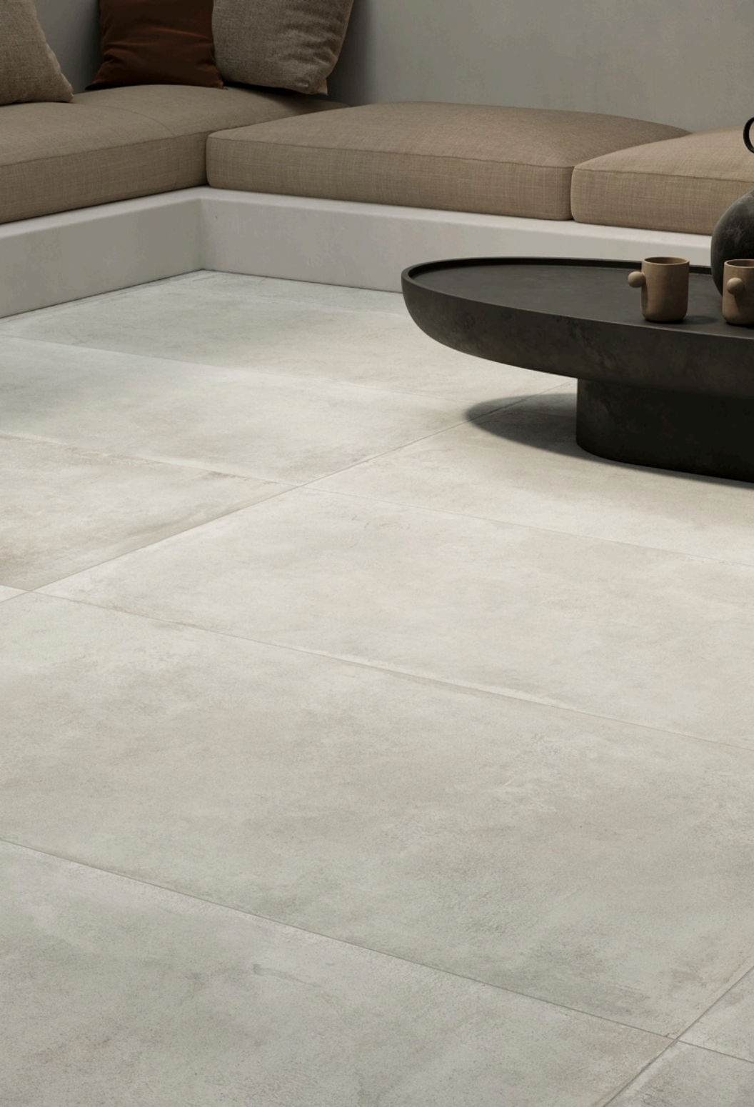
Open Air White 75 × 150