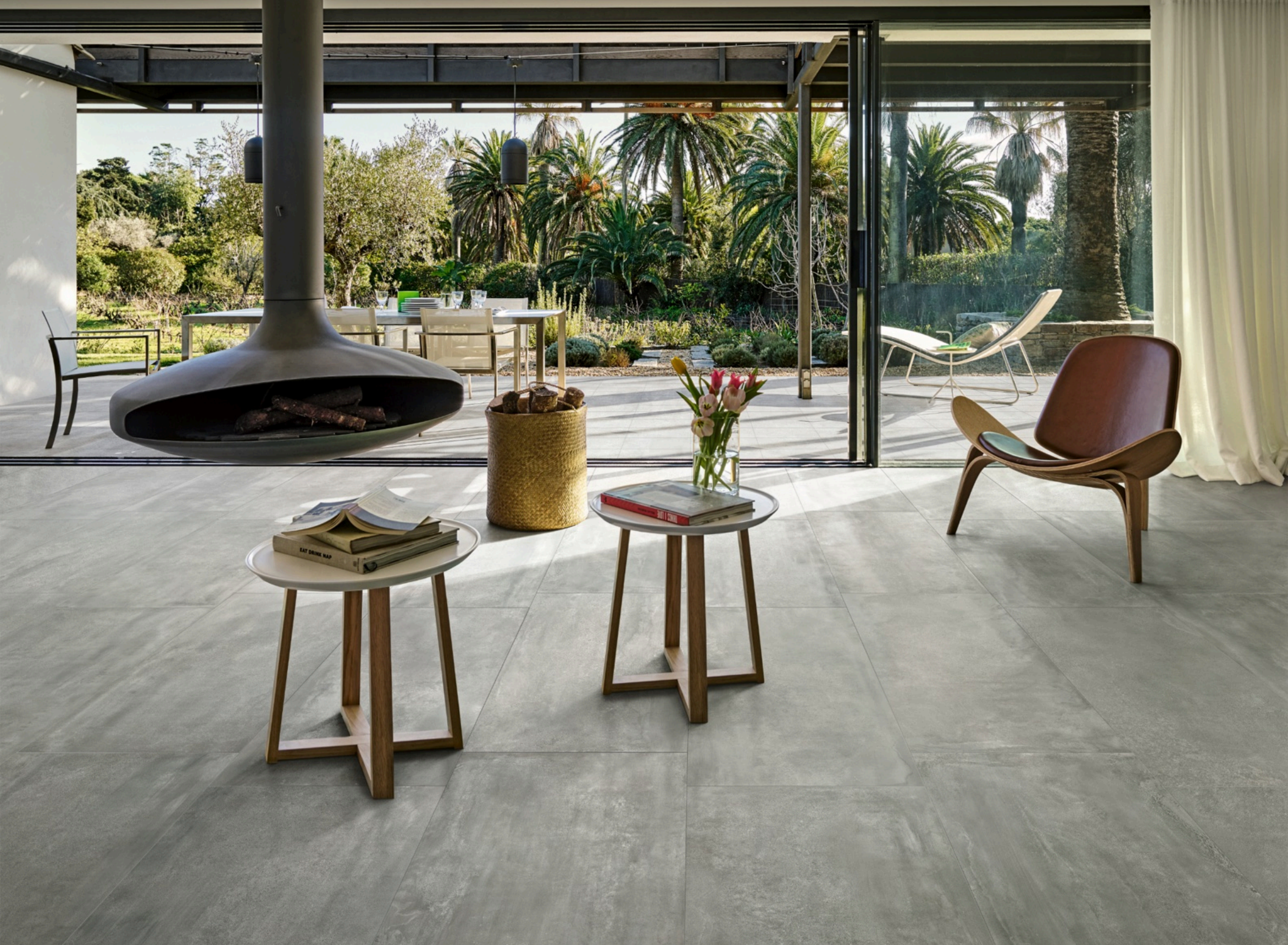
Prowalk Grey 75 × 150