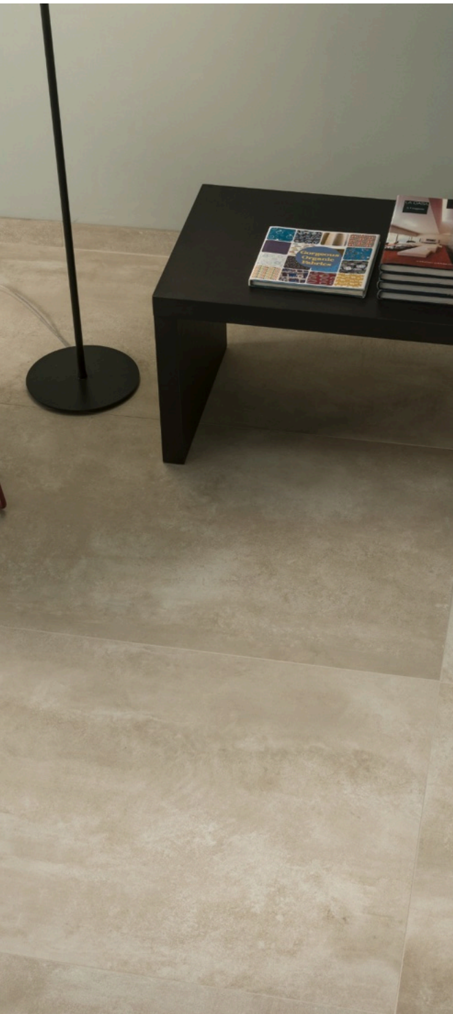
Prowalk Beige 75 × 150