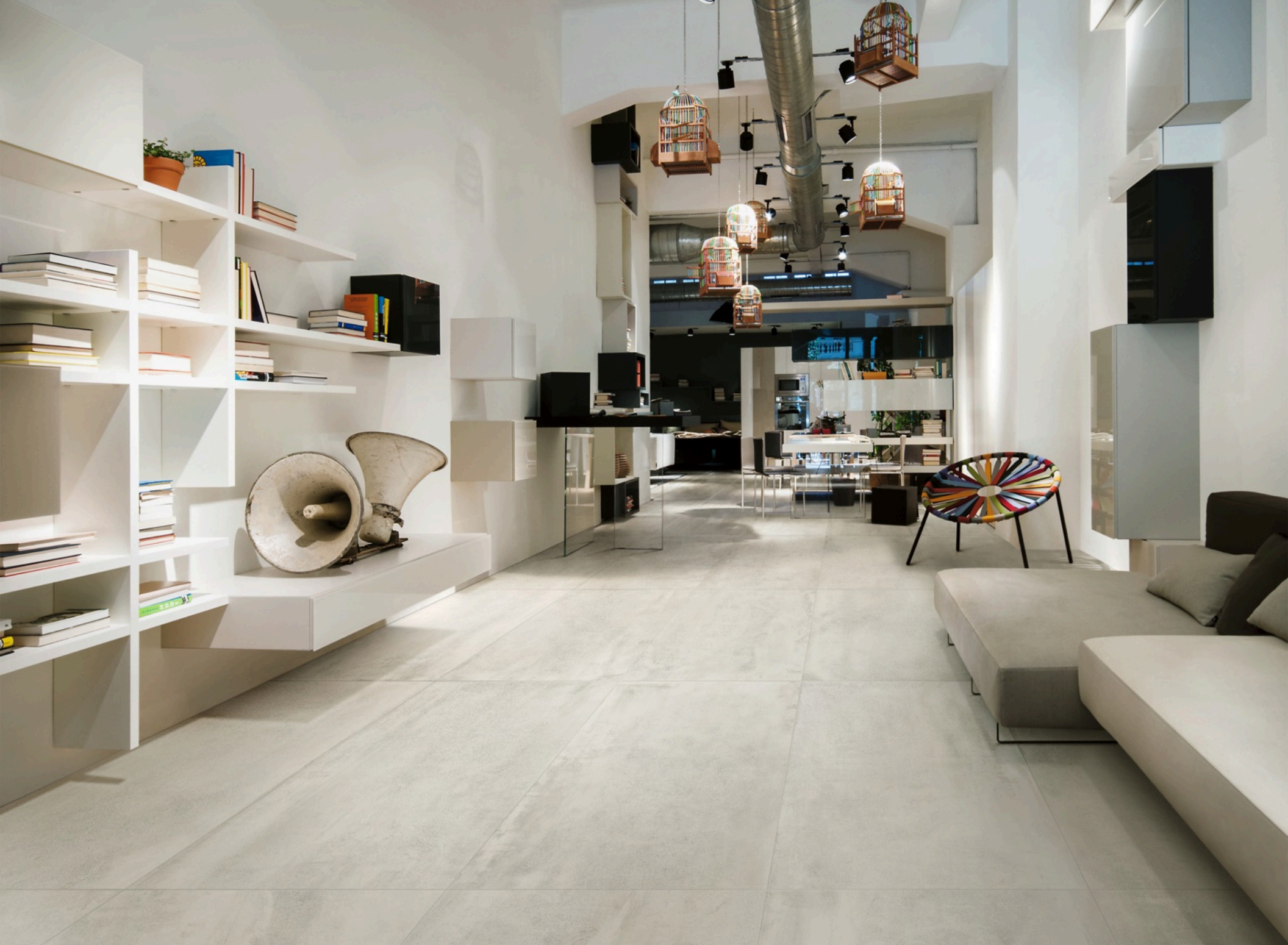
Prowalk White 75 × 150