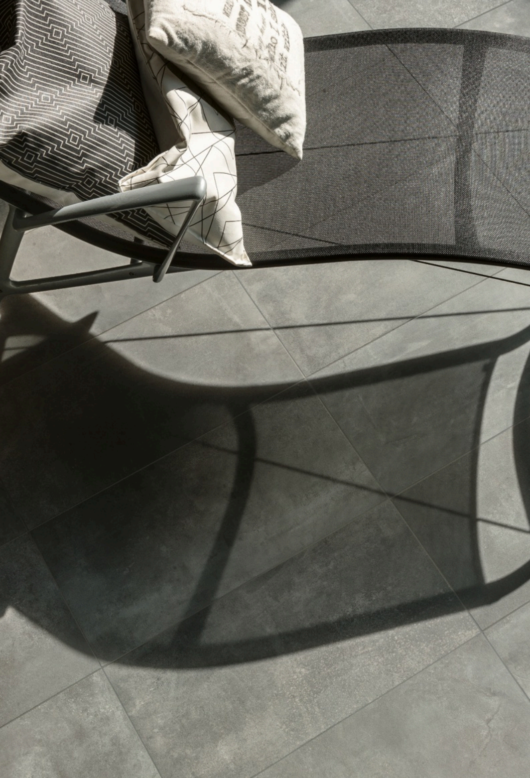
Prowalk Grey 75 × 150