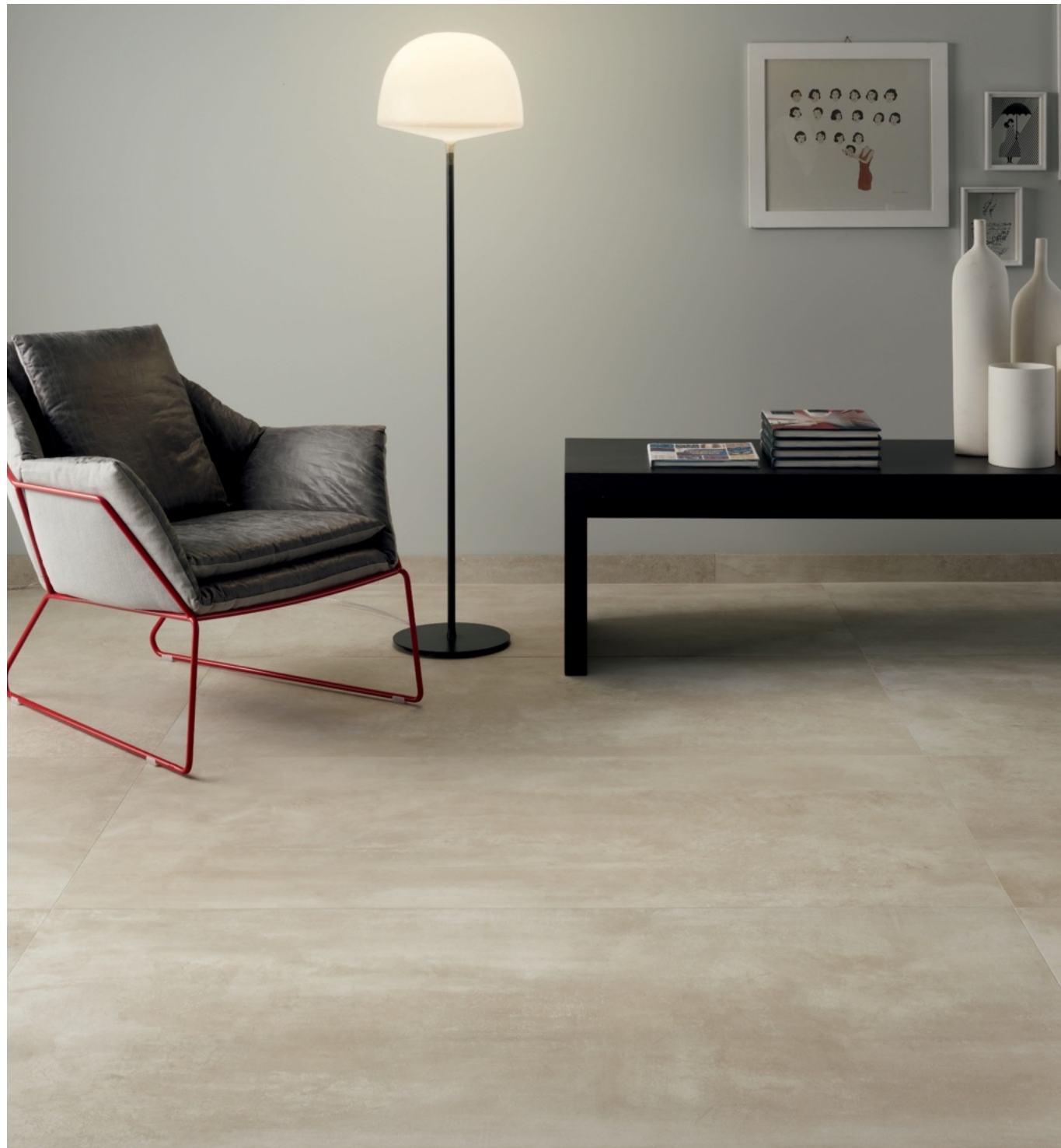
Prowalk Beige 75 × 150