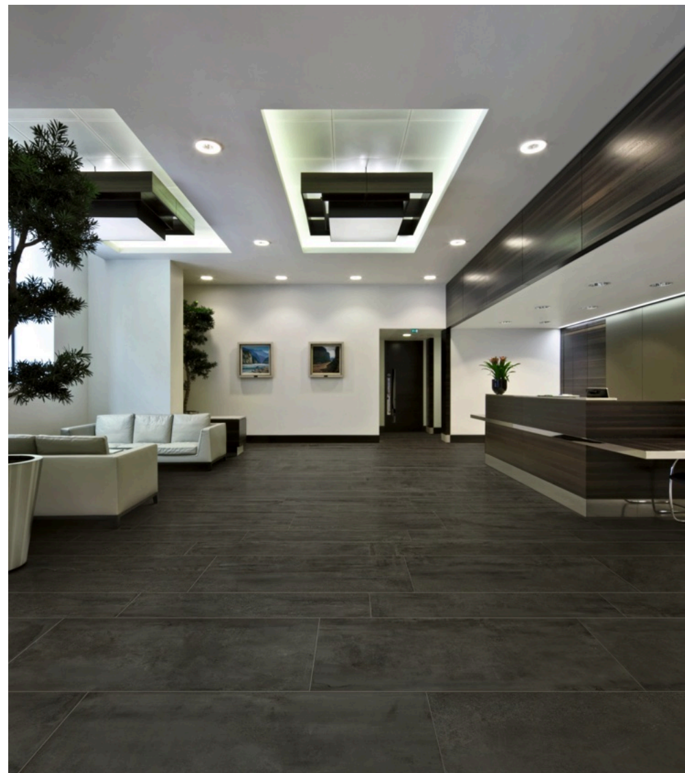
Prowalk Anthracite 75 × 150