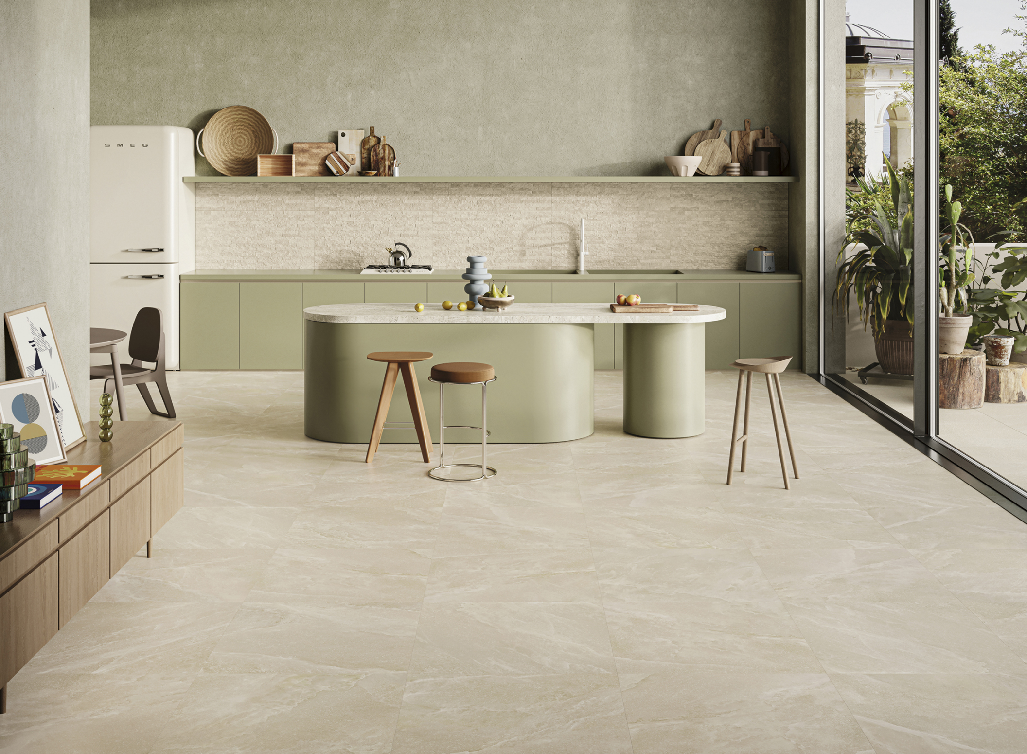
Salt Stone Sand Dust 90 × 180