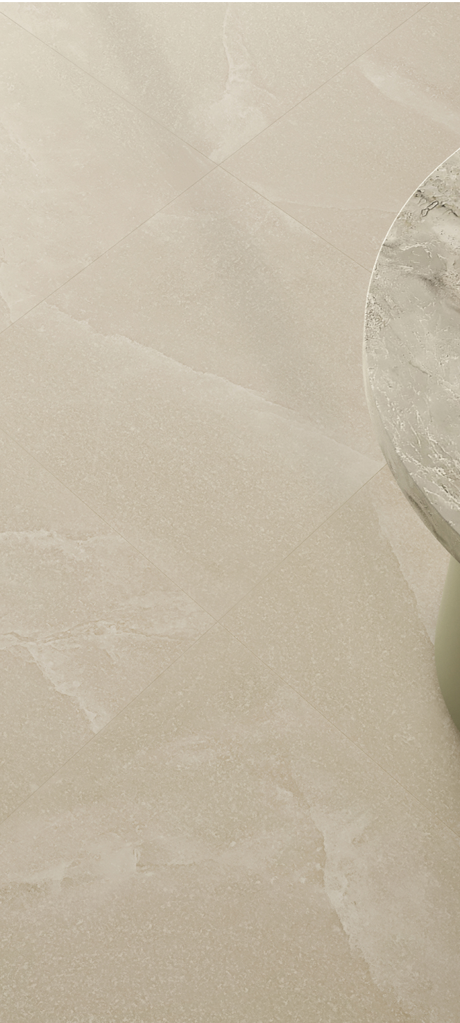
Salt Stone Sand Dust 90 × 180