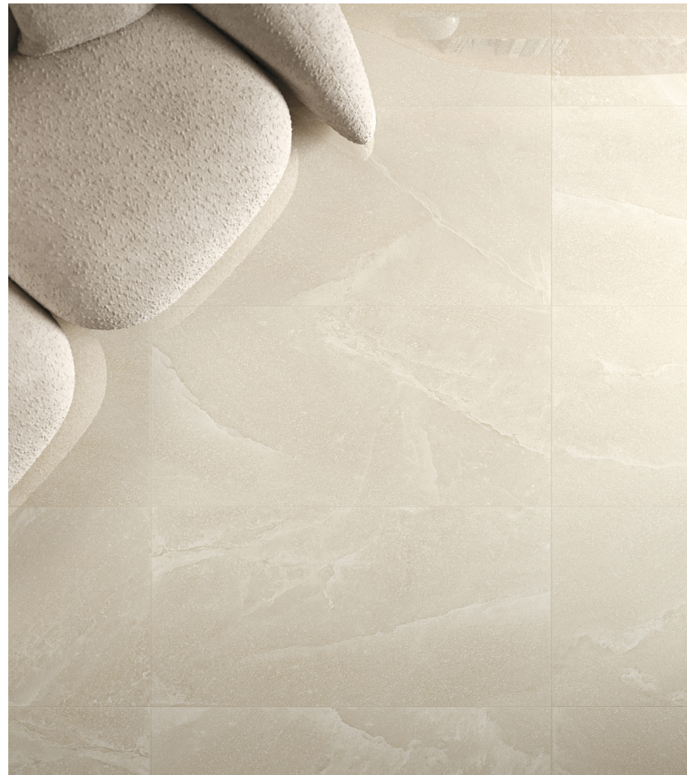
Salt Stone Sand Dust Lappato 90 × 180