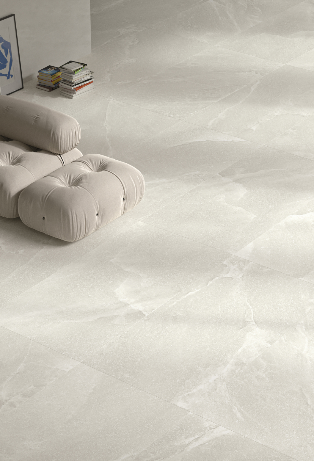
Salt Stone White Pure 90 × 180