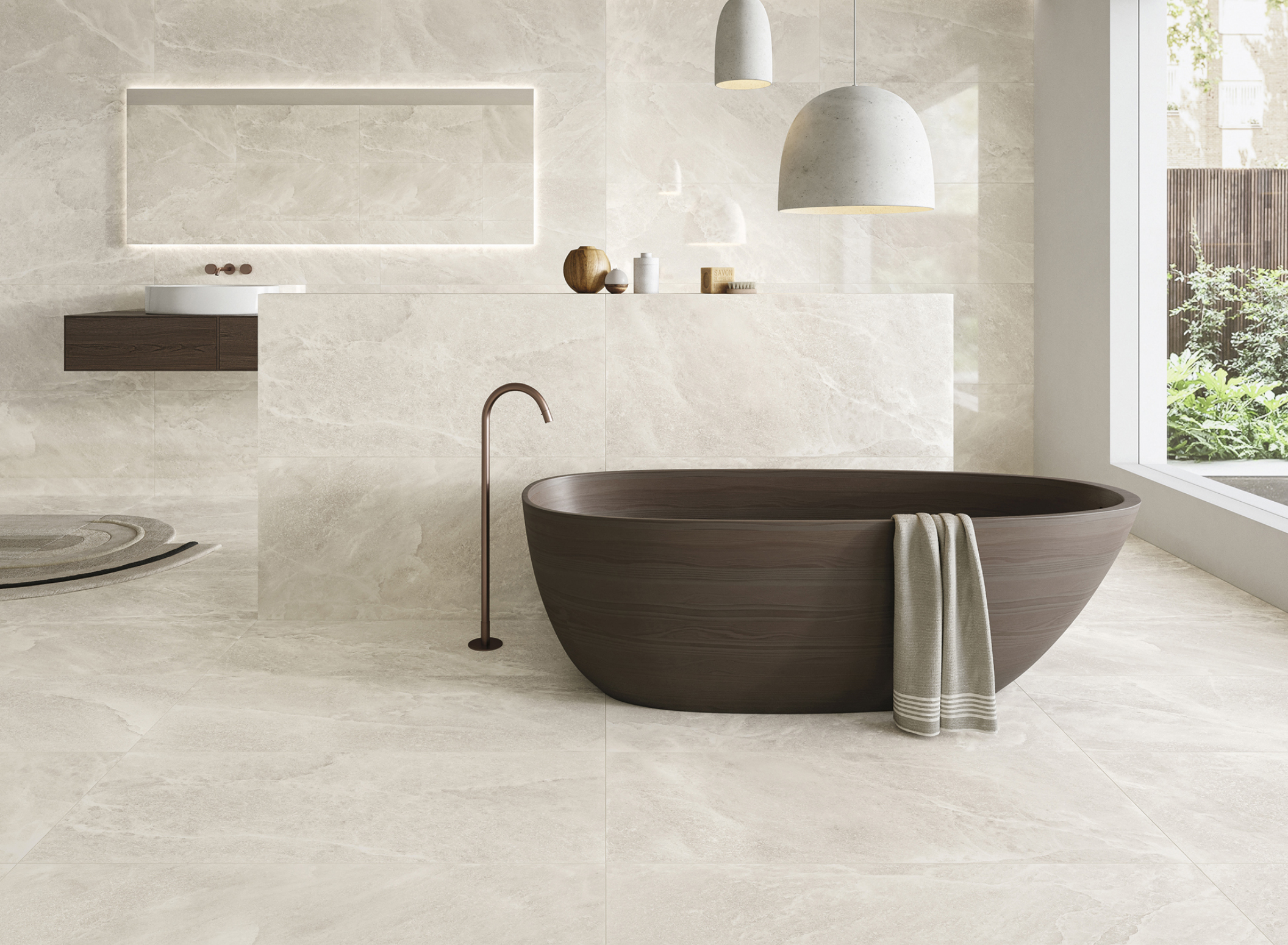
Salt Stone White Pure 90 × 180 / Salt Stone White Pure Lappato 90 × 180