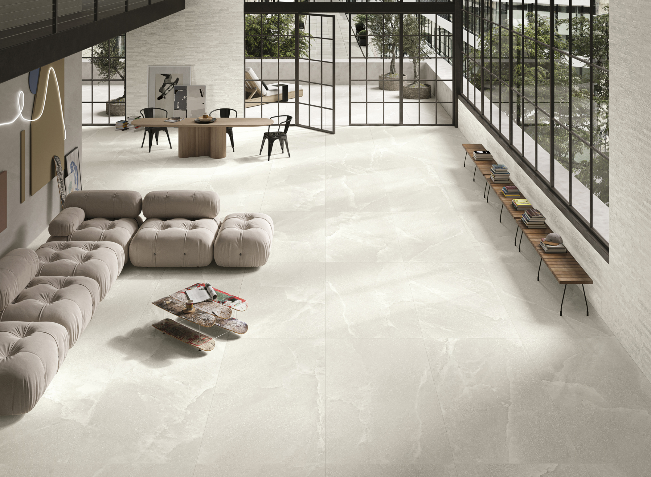
Salt Stone White Pure 90 × 180