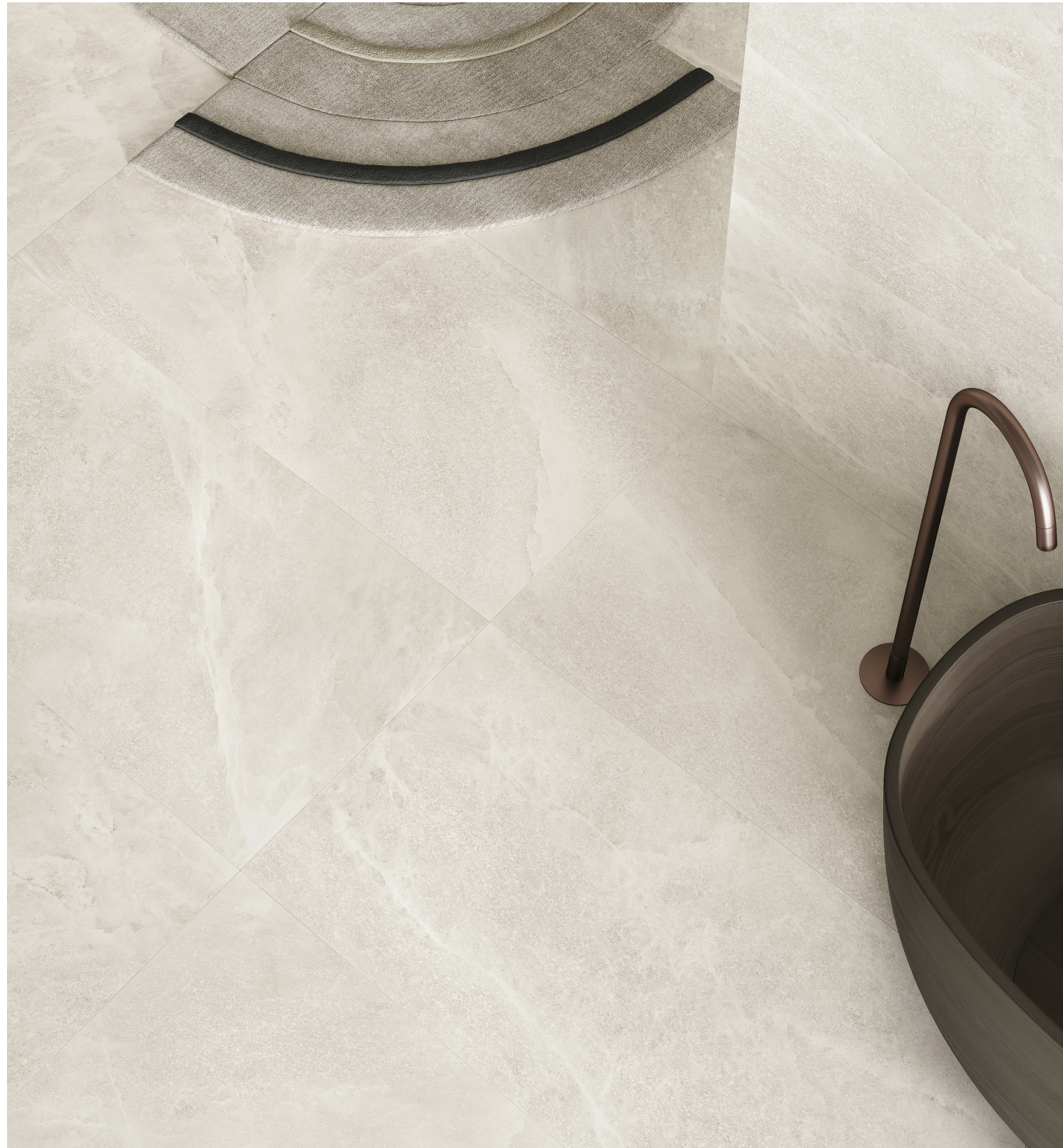
Salt Stone White Pure Lappato 90 × 180