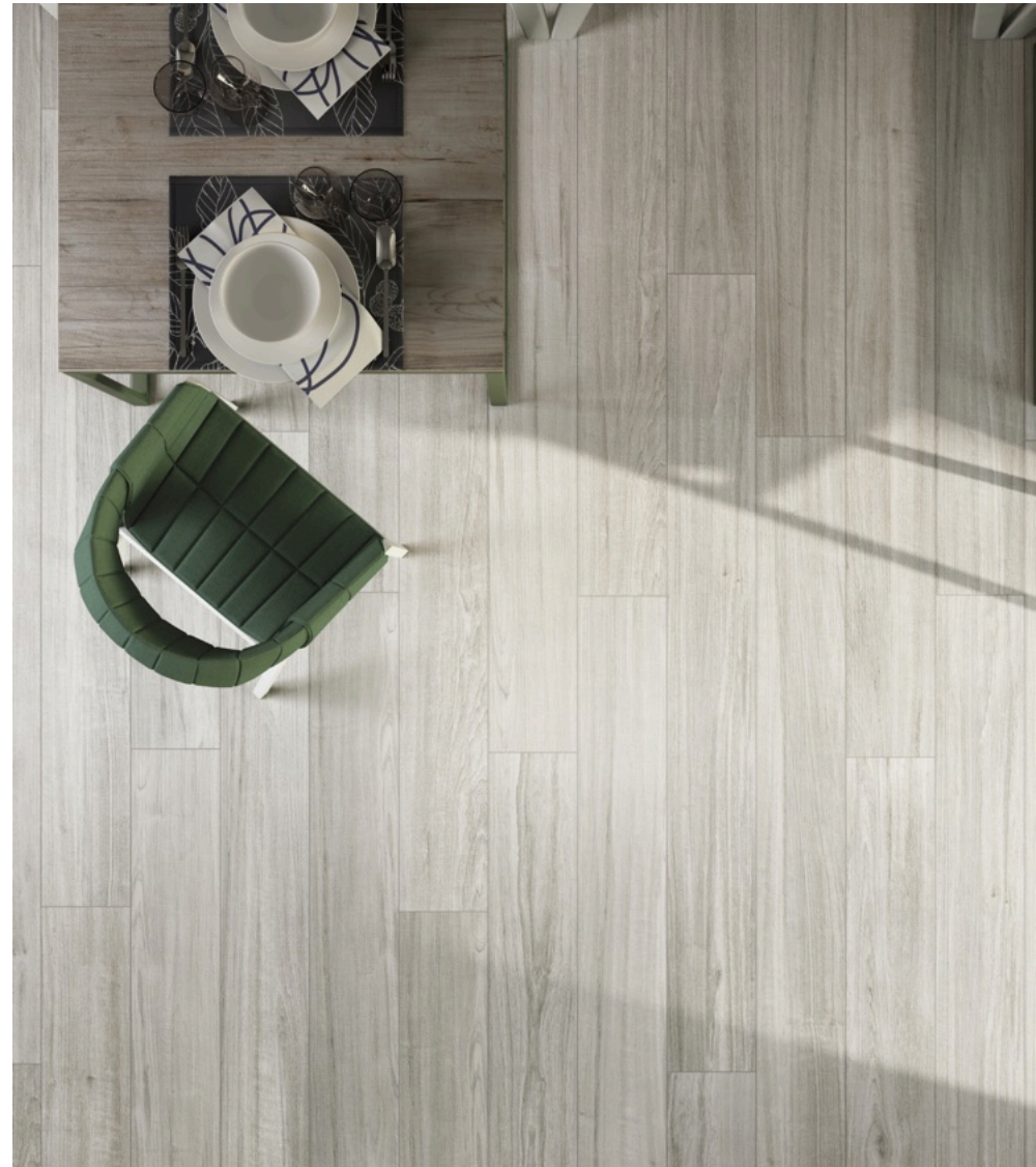
Soft Cendre 20 × 120