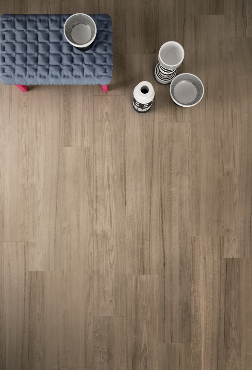
Soft Caramel 20 × 120