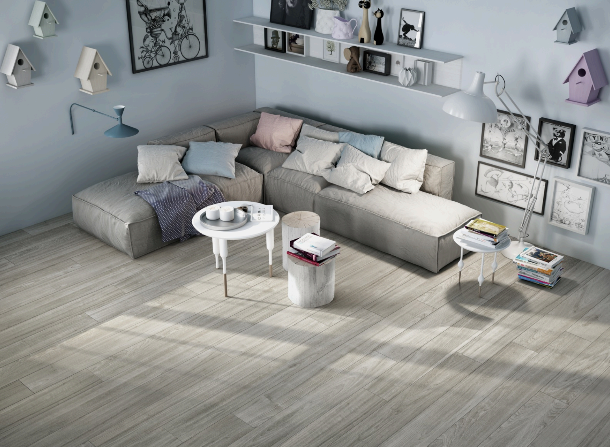
Soft Smoke 20 × 120