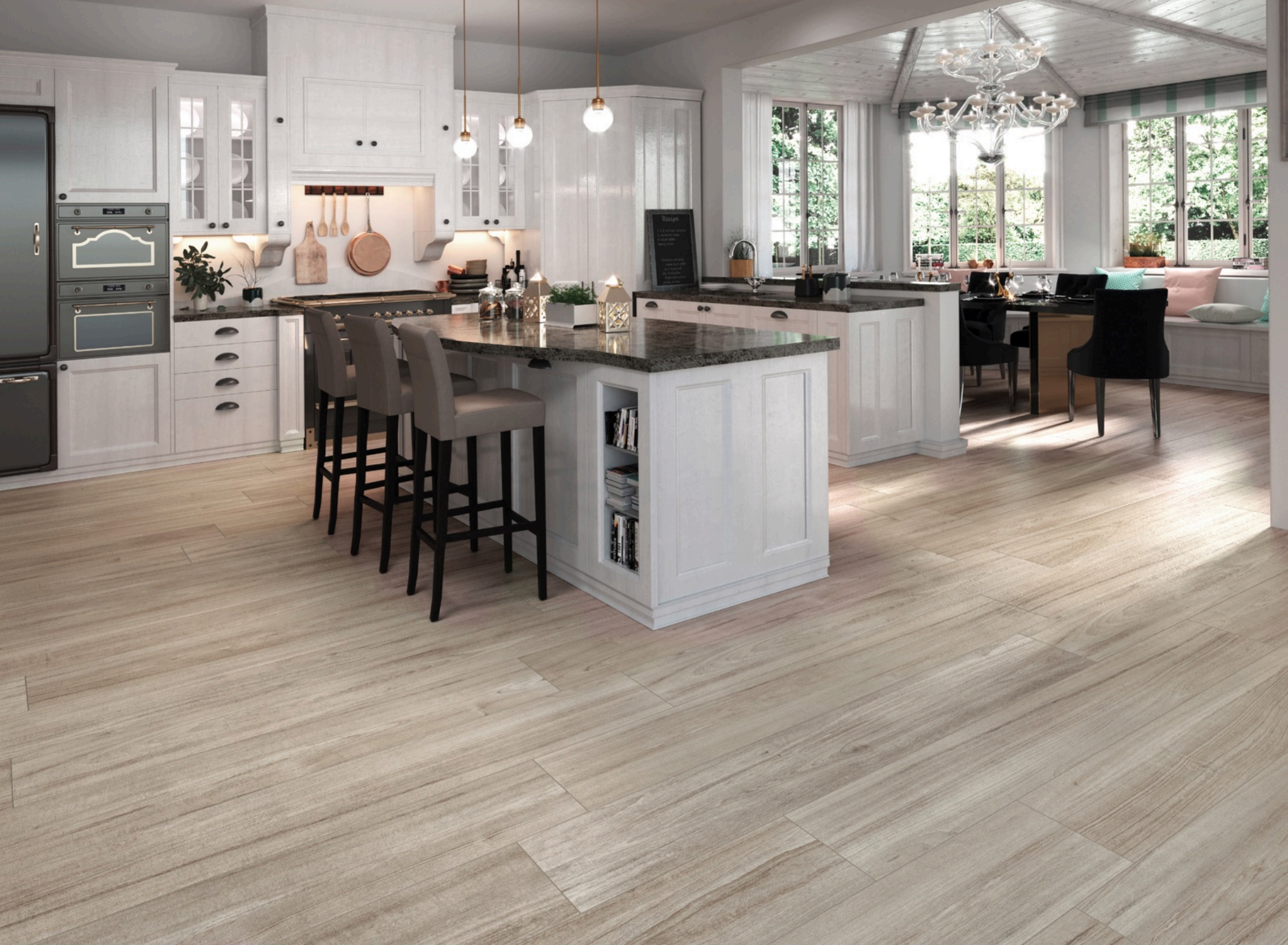
Soft Rope 20 × 120