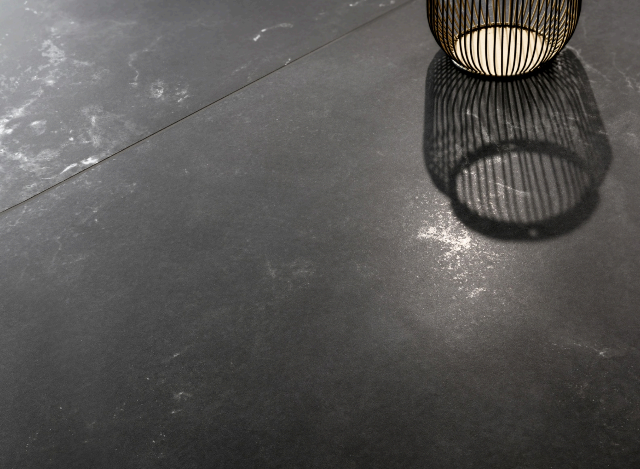
Stardust Deep Soft 75 × 150