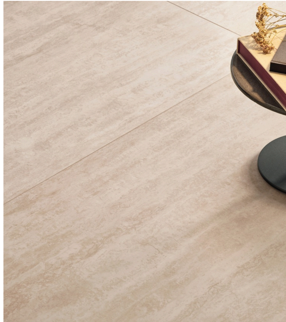
Travertino Beige 75 × 150