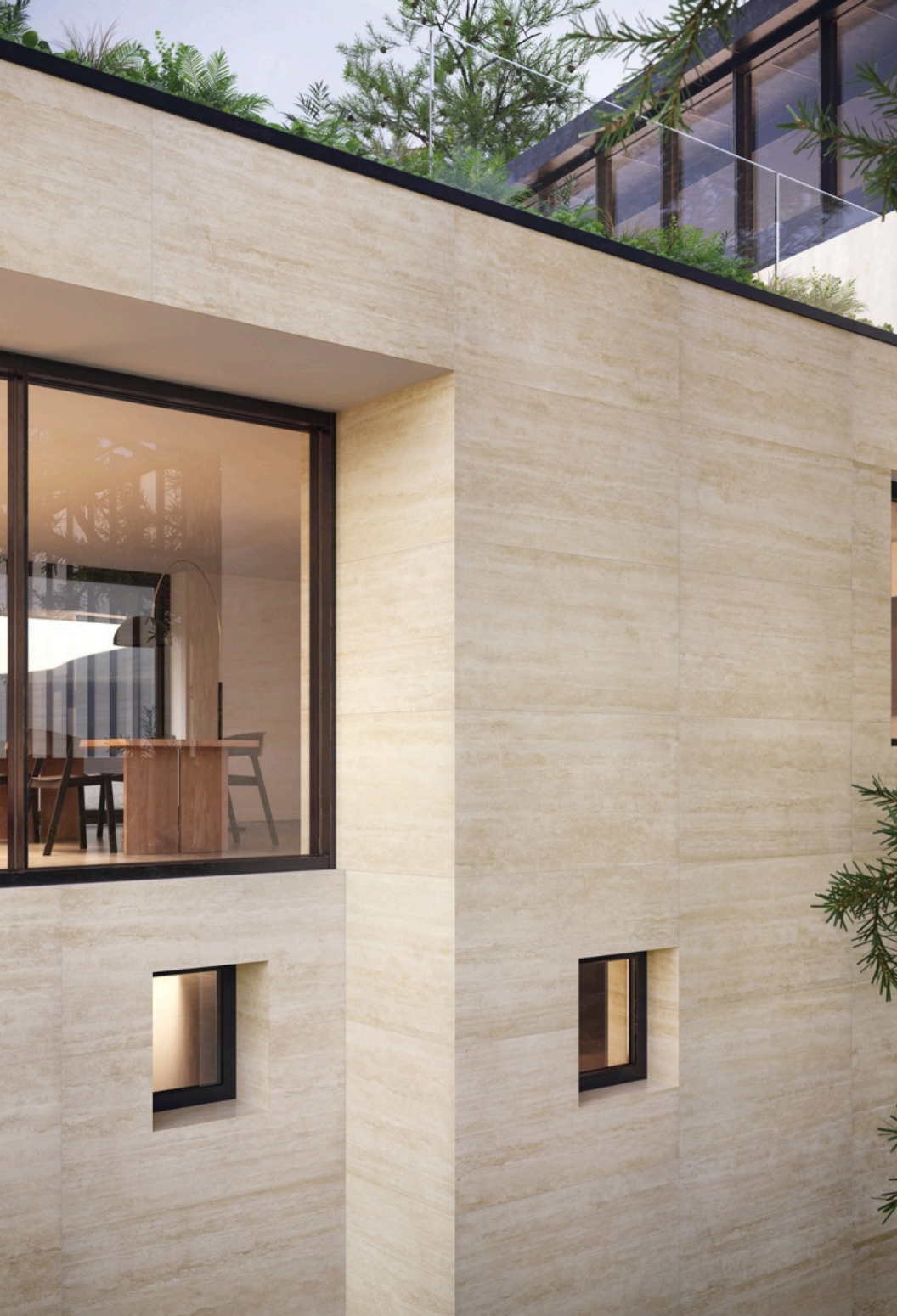
Travertino Beige 75 × 150