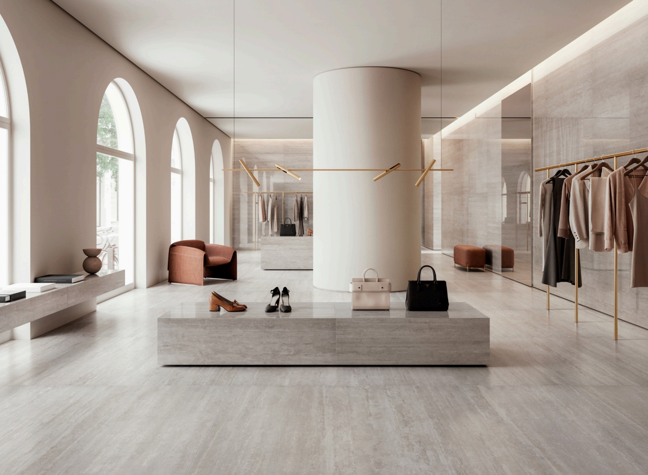
Travertino Grigio 75 × 150